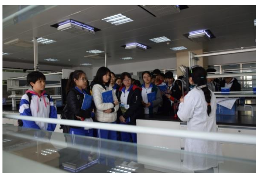
图 7 2018 年 4 月 7 日校园开放日中学生参观中心实验室

为培养孩子的科学兴趣，提升全民族的科学素养。2016 年底，中心承办了第一届“美国化学会-天津大学化学嘉年华”活动，并获得了美国化学会“国际化学分会全球贡献奖”。2018 年 4 月，中心又举办了第二届“化学嘉年华”活动，盛况空前。