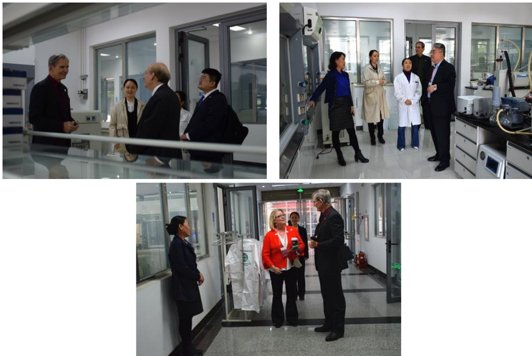
图10 2018年10月10日教育部审核评估组专家到示范中心进行实地考察, 了解实验室建设、课程体系和学生学习情况。