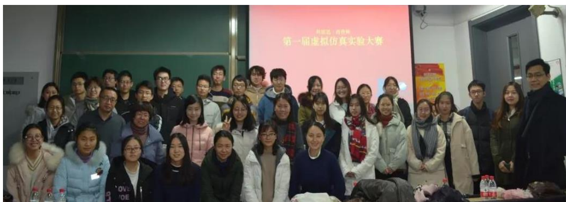
图 15 虚拟仿真实验竞赛参赛人员合影

4. 2018年12月7日，中心举办第一届“科雷讯药育”杯天津大学药学院虚拟仿真实验大赛，该活动推动了虚拟仿真实验教学项目的推广与普及。