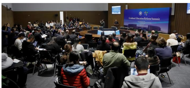
图 14 “研究生教育改革研讨会”会场照片

3. 2018年11月24日，中心承办了国际会议“研究生教育改革研讨会”，该会议旨在通过交流学习，商讨完善高端人才-博士研究生教育改革工作思路，搭建符合我国国情的博士研究生国际化教育平台，为我国的国际化教育改革建言献策。