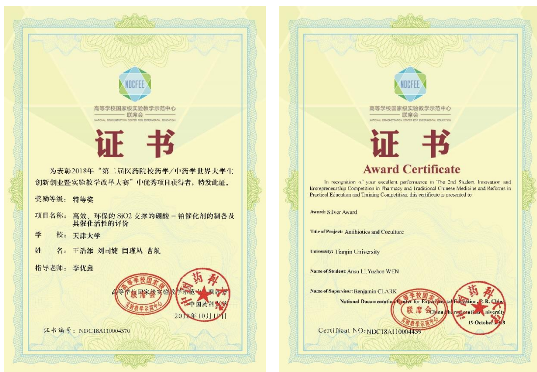
图 1. 第二届药学中药学世界大学生创新创业暨实验教学改革大赛学生获奖证书

2018 年，学生申请国创项目数 12 个，最终 7 个项目得到国家级、市级或校级经费支持，其余 5 个项目由学院给予经费支持，以提高本科生参与创新实践的积极性。全年组织中期审查和结题验收的项目共 17 项，均顺利通过。