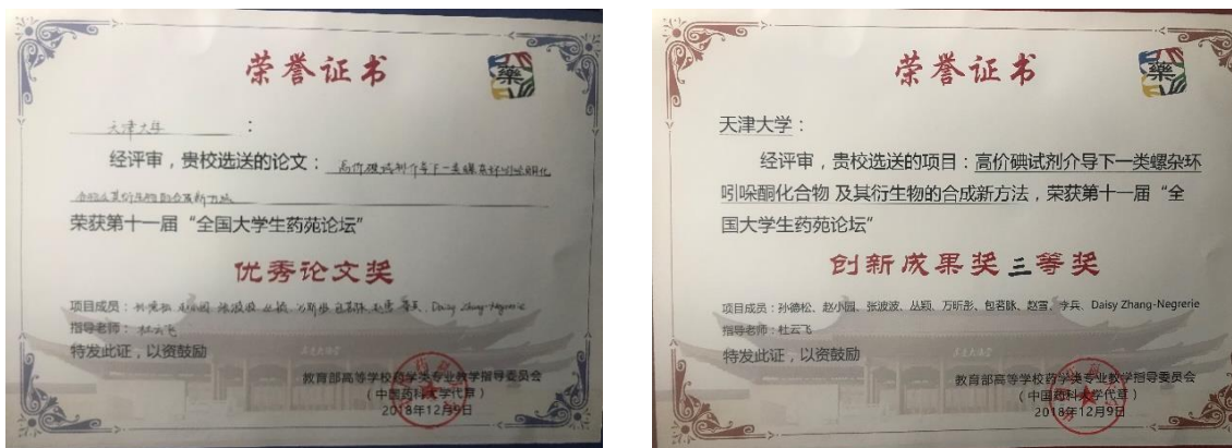
图 2. 第十一届药苑论坛学生获奖证书