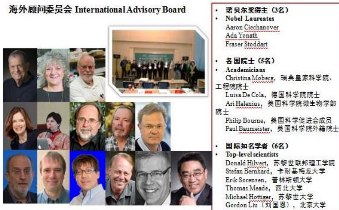
图3 “顾问委员会”海外专家成员

另外，邀请 14 位海外顶级专家组成“顾问委员会”，开展相关教学、科研合作，为中心的发展把关、诊断、提供指导与建议。形成“国内执行团队+海外顾问团队”为主体，探索以西方先进管理理念为引领，中方执行团队推动实施的管理模式。该模式既保证了药学专业按照国际通行教学模式与标准发展，又实现了与现阶段国情、校情、院情的准确对接和调整，为全力打造实验教学高端品牌保驾护航。