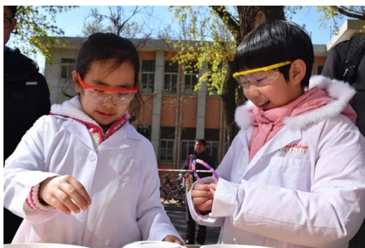
图 8 2018 年 4 月 7 日第二届“美国化学会-天津大学化学嘉年华”活动

为培养孩子的科学兴趣，提升全民族的科学素养。2016 年底，中心承办了第一届“美国化学会-天津大学化学嘉年华”活动，并获得了美国化学会“国际化学分会全球贡献奖”。2018 年 4 月，中心又举办了第二届“化学嘉年华”活动，盛况空前。