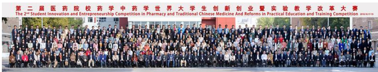
图 12 第二届医药院校药学中药学世界大学生创新创业暨实验教学改革大赛参加人员合影

该活动的举办，大大促进了中心与国内外同行的沟通与交流，加强了国际兄弟院校间的学习与合作，也极大地提升了中心在海内外药学领域的声誉和影响。