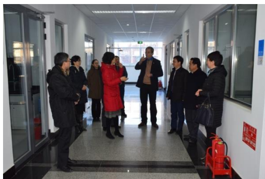
图 6 2018 年 1 月 11 日宁波大学代表团参观中心