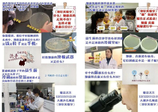
图9 天津电视台少儿频道《锋狂实验室》节目预告